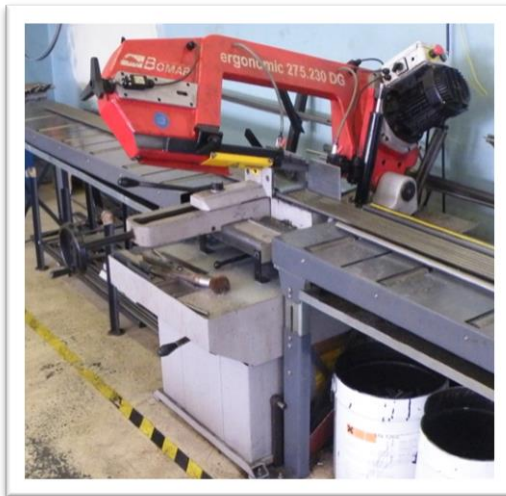
Pásová píla Ergonomic 275.230 DG